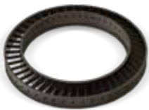
Palheta de turbina com resistência à corrosão a altas temperaturas com certificação HX (A)