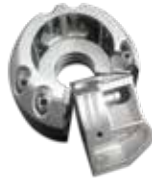
Molde de sopro com orifícios de conformação em aço Maraging LaserForm (B)