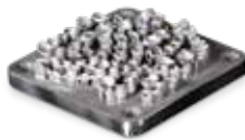
Parciais, coroas e pontes dentárias em LaserForm CoCr (C)