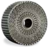
Trocador de calor com canais complexos de resfriamento em LaserForm AlSi10Mg (A)

A ampla gama de materiais LaserForm prontos para operação da 3D Systems é formulada e ajustada especificamente para as impressoras DMP da 3D Systems para proporcionar alta qualidade de peça e propriedades de peça consistentes. A 3D Systems fornece um banco de dados de parâmetros de impressão amplamente desenvolvido, testado e otimizado com materiais nas instalações de produção de peças da 3D Systems. Essas instalações têm a experiência exclusiva de imprimir mais de 1 milhão de peças de produção em metal complexas em vários materiais, ano após ano.