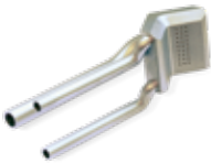
Queimador de gás com canais de resfriamento integrados em LaserForm Ni718 (A)