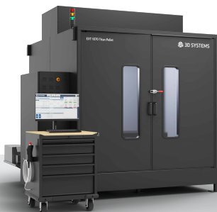
EXT 1070 Titan Pellet / LT