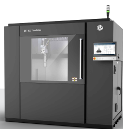
EXT 800 Titan Pellet

**Vazão volumétrica máxima com bocal de 9 mm