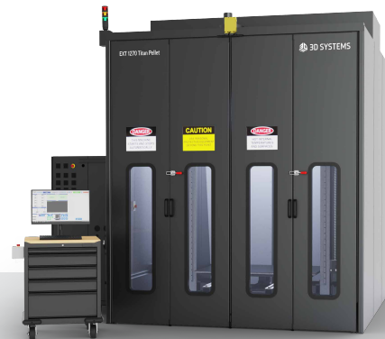
EXT 1270 Titan Pellet